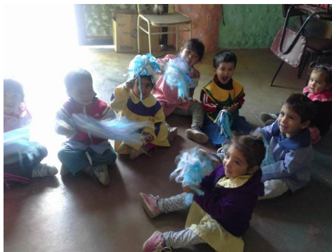
Imagen Nº 1 : Jardín Pasitos de Ilusión

“La Educación no cambia al mundo, cambia a las personas que van a cambiar el mundo” (Paulo Freire)