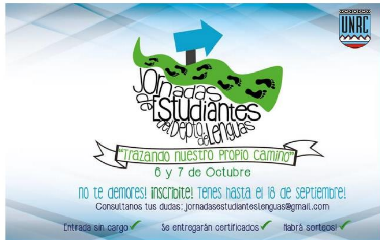
Imagen N° 2. Fuente: III Jornadas de Estudiantes del Departamento de Lenguas “Trazando Nuestro Propio Camino” Un espacio para lo académico, lo social y lo cultural. Facultad de Ciencias Humanas, Universidad Nacional de Río Cuarto, 2015.

Disponible en: http://www.hum.unrc.edu.ar/descargas/Jornadas%20Estudiantes%20de%20Lenguas%202015%20-%20Primera%20Circular.pdf