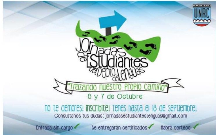
Imagen N° 2. Fuente: III Jornadas de Estudiantes del Departamento de Lenguas “Trazando Nuestro Propio Camino” Un espacio para lo académico, lo social y lo cultural. Facultad de Ciencias Humanas, Universidad Nacional de Río Cuarto. 2015.

Disponible en: http://www.hum.unrc.edu.ar/descargas/Jornadas%20Estudiantes%20de%20Lenguas%202015%20-%20Primera%20Circular.pdf