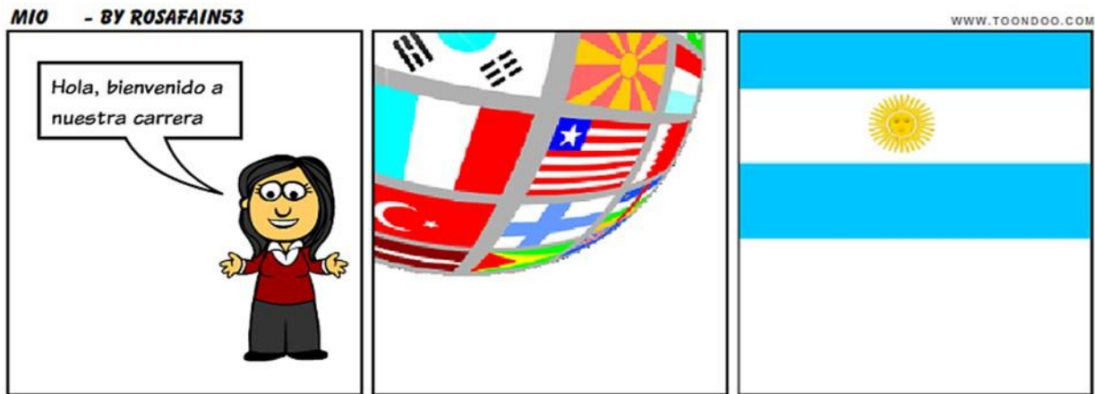
Fig. 2. Bienvenida a la Carrera

¿Qué te sugiere la historieta? ¿Recuerdas sobre leer críticamente? Cada uno de nosotros traemos distintas vivencias y experiencias, por lo tanto la forma de interpretar es diferente. Ahora cuéntenos cómo interpretas la historieta anterior.