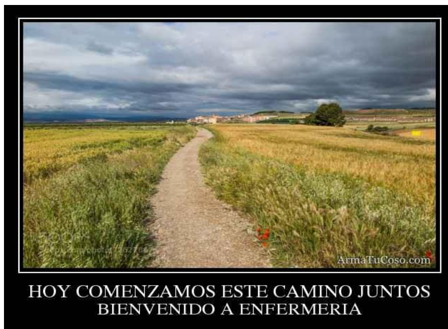
Fig. 1. Bienvenida.

Descripción: la Fig. 1 En el afiche puede observarse un camino de tierra que se aleja entre dos campos sembrados de trigo, con un cielo que alterna diferentes matices de nubes, azul, celeste, blanco y gris. Debajo de esta imagen dos frases; una dice "Hoy comenzamos este camino juntos" y la segunda "Bienvenido a Enfermería".