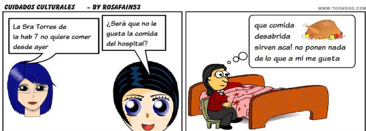
Fig. 5. Cuidados Culturales

Actividad N° 4: observa y lee la siguiente historieta.