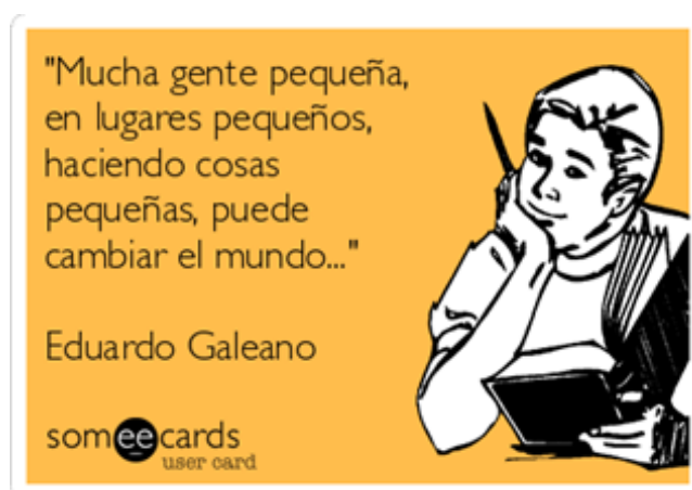
Figura 1. Recuadro que contiene hacia la derecha la imagen de un estudiante en posición de reflexión con un libro en una mano y un lápiz en la otra; y hacia la izquierda una cita del escritor Eduardo Galeano que dice: "Mucha gente pequeña, en lugares pequeños, haciendo cosas pequeñas, puede cambiar el mundo".