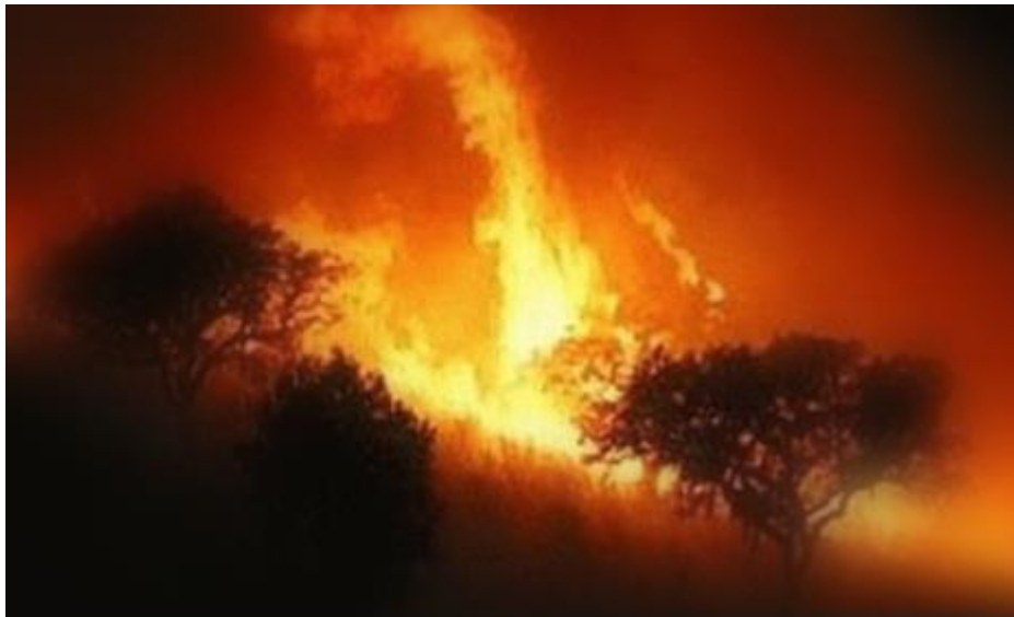
Figura 4: En la imagen se visualiza un incendio forestal nocturno registrado en la Sierra de Comechingones en Agosto de 2009. En la misma se pueden ver llamaradas de grandes dimensiones por detrás y árboles nativos y pastizal incendiándose por delante.

Dicho estudio fue posible a partir del procesamiento de imágenes satelitales de las áreas afectadas por el fuego en el año 2009, en las cuáles se muestran los cambios ocurridos en la vegetación y la correlación entre el tipo de incendio y la capacidad de recuperación de la misma.